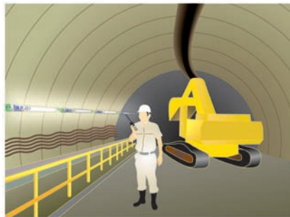
高温多湿な空間でも

※FL40SN 全光束2,950lm タフィンバータ消費電力40W 安定器消費電力47.5Wにて算出