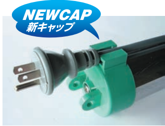
運搬時に電源コードをスッキリ収納