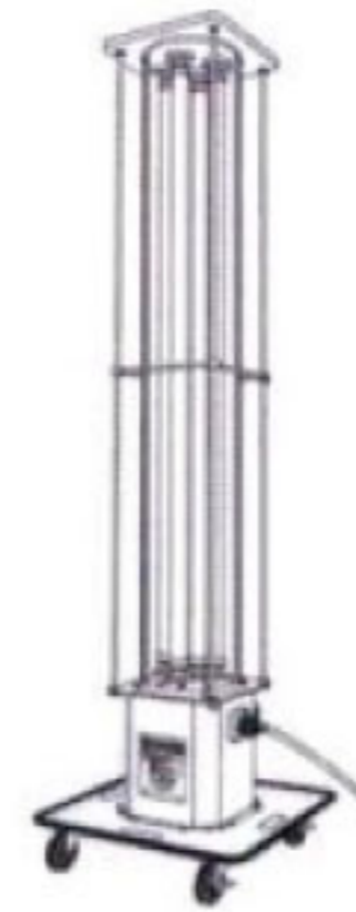
ひかりたろう 光太郎 パノラマ式スタンド

店舗の内装工事、リフォーム工事等に最適。 蛍光灯照明と電ドラムの両機能を兼ね添えた屋内用仮設照明です。 リース・レンタル会社紹介いたします。