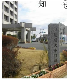
川越市役所前にある大手門跡の碑

蔵造りの町並みが有名な川越は、歌舞伎や大河ドラマにも登場する源義経に深く関わっています。義経は川越周辺を治めていた河越重頼の娘を正妻にしています。重頼の大きな勢力を味方につけた頼朝の命により、重頼の娘・郷御前と義経は政略結婚させられます。京都から輿入れしたので京姫と呼ばれた郷御前と義経は夫婦仲がとても良く、頼朝からの追討の際も実家である川越には戻らず夫に付き従い、共に生涯を終えます。河越氏の館跡は近年の宅地開発で失われていたのですが、地元住民の寄付で再建立され、重頼・義経・郷御前(京姫)の供養塔もあります。